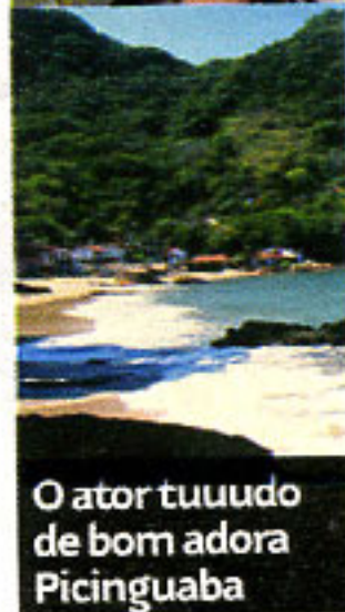
O ator tuuudo de bom adora Picinguaba

PARA NAMORAR ou fugir da badalação, o lugar perfeito é Picinguaba, no Parque Estadual da Serra do Mar, litoral norte de São Paulo, perto de Ubatuba. É para esse paraíso que fujo sempre que desejo esquecer o caos urbano. Ali, sento na areia e vejo a vida passar. Fico na Pousada Picinguaba [ www.picinguaba.com , tel. (12) 3836-9105], que tem uma vista linda para o mar e para a praia da Fazenda, completamente selvagem. À noite, janto na cidade. Uma opção é o Restaurante da Matriz, que serve um risoto de frutos do mar delicioso. Se quero passear pela região, pego o carro e depois de meia hora estou em Parati, no RJ." REPORTAGEM CAROL RUY